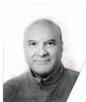
Valdi Tiepolo - Viaggiare Slow Cicloturismo / Scuole info@viaggiareslow.it